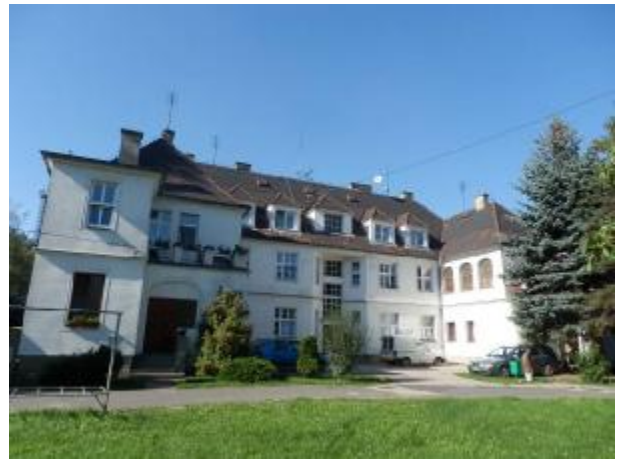
Budova č.p. 486