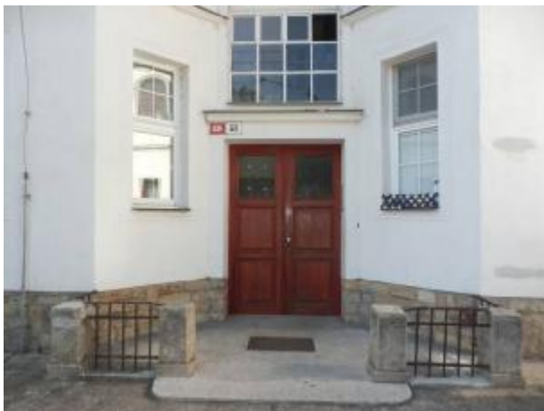
Vstup do č.p. 486